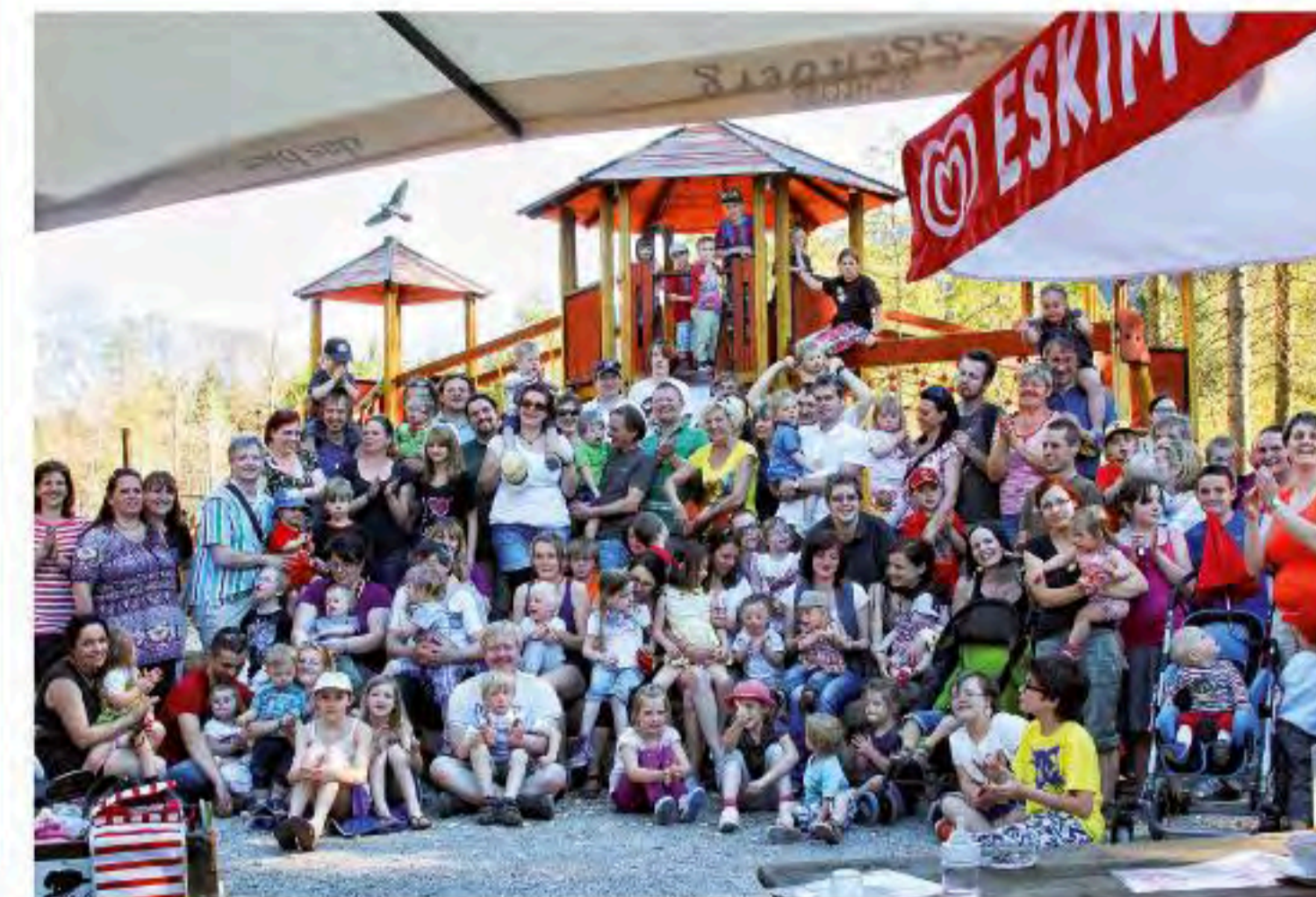
Frühjahrs-Ausflug in den Wildpark Grünau

Dort finden Sie Infos, Bilder sowie Hinweise auf aktuelle Termine für Veranstaltungen und Treffen.